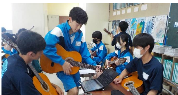
ICT を活用した授業の様子

手洗い、手指消毒をしっかりと行っていることから、環境対策の一環として給食配膳時のビニール手袋の着用を廃止しました。これにより、学級から出る8割のプラスチックを削減することができました。その取り組みを八千代市子どもサミットで発表し、市内の小中学校に共有しました。