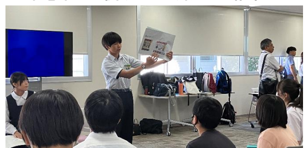
子どもサミットで発表する様子