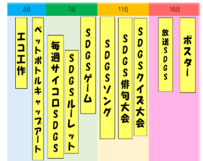
ESD委員会活動計画案

まず、ESD委員会の児童が、始めたことは、西高津小学校の児童がSDGsについてどれほど知っているのかについて、調査をしました。その調査から、SDGsについて知らない児童が多いということが見えてきました。それは、委員会の児童も例外ではありません。そこで、ESD委員会では、西高津の児童が“SDGsについて知り”、“SDGsについての催しを行う”ことで、“普段の生活の中にSDGsが意識されるようになる”と考え、活動計画を立てました。ESD委員会では、“楽しく、たくさん考えよう！SDGs！”を合言葉に活動を計画しました。また、今まで、常時活動で行ってきた活動について振り返り、その活動とSDGsの関連について考えました。