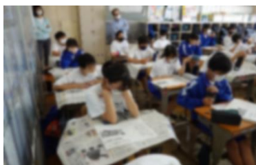
01の授業で新聞を読む生徒たち

ESDを核とした学校教育に取り組むために、教師も意識改革を行いました。生徒が、目の前の教材と社会とのつながりをとらえ、自分事として学習に向かうようになるにはどうしたら良いか、考えを巡らせました。その道のりの中での一つの取り組みとして、その単元、その授業において意識させたいSDGsのゴールを設定し、学習指導案にも明記して、ESDを意識した授業研究に取り組みました。