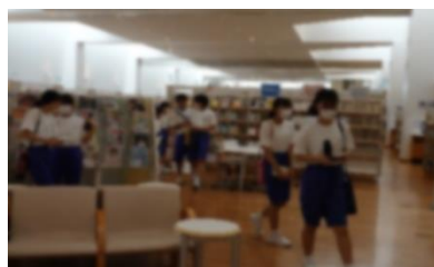
02の授業で図書館を訪れた生徒たち