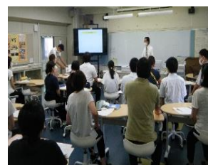
ESD 研修会。講師を招き、先生たちも学んでいます。