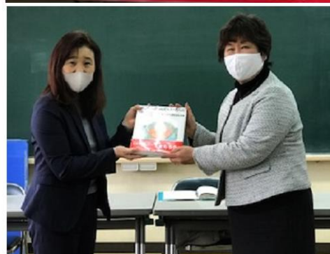
高津・緑ヶ丘地域 防犯マップ