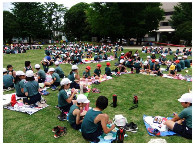
芝生の上での交歓昼食会