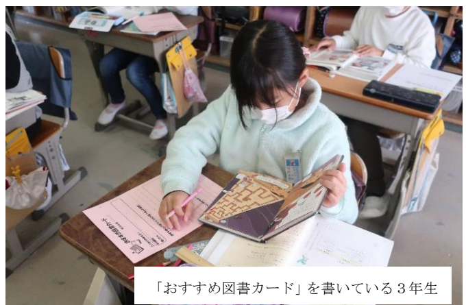
「おすすめ図書カード」を書いている3年生

ベビーたちが冒険をしたり、新しい出会いがあったり、ゆかいなところもあるので、冒険の本が好きな人におすすめです。また、絵も多く、楽しいので本が苦手な人にもいいです。