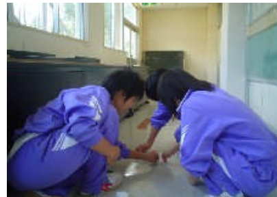
＜清掃の行き届いた学校＞