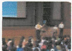
○交通安全課の方の話をしっかり聴きました。