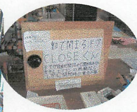
○ドアがエネルギーを使わずに開まるドア。よく考えましたね！