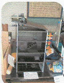
○太陽光を室内にとりいれる節電マンション

見られたように思いました。どの作品・論文とも一生懸命研究した跡がみられ、夏休み中の頑張りがよく分かりました。