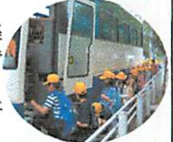
校外学習に出発する4年生。ちなみにこのバスは4000万円もする最新型のバスだそうです。すごい!

いなどをさせたり、いろいろな経験をさせていくことが、勉強ができるようになるコツの一つです。ぜひご家庭でもお子様と長さ調べや調理などしてみてください。