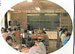
6年生の理科の学習風景。ものが燃えることについて実験中です。

学校では教室での学習だけでなく、校外学習などの機会を使って学習を進めています。4年生は先日、千葉県立中央博物館及び千葉県市科学館に校外学習に出かけました。県立中央博物館では学芸員の方から説明を受けることができたので学習も更に深まったようで、校外学習の目的が果たせたと思います。