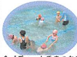
バディーと手をつないで水に顔をつけます。何秒我慢できるかな?