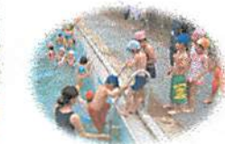
1年生は、プールサイドのはしごから、そーっとプールに入りました!

1年生のプール学習では水位を下げるのですが、今年は例年より水位を低くしたこともあって、プールに入るのにプールサイドのはしごを使ったこともあり、とても緊張しているようでした。でもプールに入ると大きな歓声を挙げて楽しみながらプー