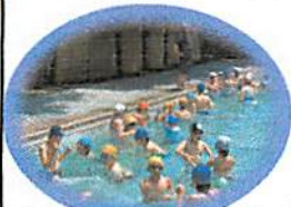
みんな気持ちさそうにしました!