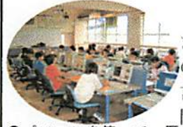
パソコンを使って、歴史のまとめをしました

6月に入り学習も本格化しています。1年生の教室からは、国語の学習で「あいうえお」を使って言葉の学習が進められている声が聞こえます。2年生の算数では、「長さ」の学習を進めているクラスが多いようです。物差しで長さを測ったりするのですが、物差しがうまく使えない子どももいるようです。5年生は調理実習でゆで卵をつくり殻むきをしていました。少々おぼつかない手つきではありましたが、頑張ってやっていました。