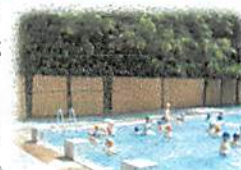
今年もプール側面には葦簀を貼りました。

6月に入り、寒かったり暑かったりする日が続き、プール開きができるか心配していたのですが、6日(月)に予定通り開催できました。6日は、気温が30℃に達し、水温も24.2℃でまずまずのコンディションでした。準備体操等を行って、さっそくプールに入り、6年生が初泳ぎを楽しみました。今年も無事プール学習がスタートできました。