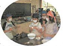
ゆで卵の殻むき中。何となく手元が...

6月に入り学習も本格化しています。1年生の教室からは、国語の学習で「あいうえお」を使って言葉の学習が進められている声が聞こえます。2年生の算数では、「長さ」の学習を進めているクラスが多いようです。物差しで長さを測ったりするのですが、物差しがうまく使えない子どももいるようです。5年生は調理実習でゆで卵をつくり殻むきをしていました。少々おぼつかない手つきではありましたが、頑張ってやっていました。