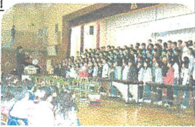
○圧巻だった6年生の合唱

6年生の今年の演奏は昨年と比べ、ぐっとレベルアップしたと思います。特に合唱が素晴らしかった。さすが6年生でした。下級生のよい目標になったのではない