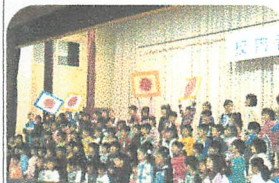
○物語風の1年生の演奏

でしょうか。去年は「ルパン3世(その正体は誰だったでしょうか?)」が登場して演奏を盛り上げていましたけれど、今年は演奏でしっかりと勝負できるレベルでした。合唱はとてすてきで感激しました。中学校に行ってもきっとすてきな歌声を響かせてくれることでしょう。ところで、あの『ルパン3世?』はどこに行ったのでしょうかね。