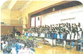
○美しいハーモニーの5年生

5年生は去年は「今日から明日へ」を歌ったのですが、今年は練習の成果を遺憾なく発揮し、美しいハーモニーが醸し出す素晴らしい合唱がで