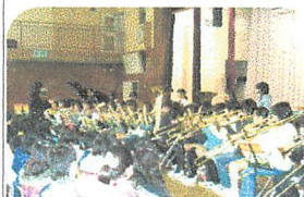
○バンドの輝く演奏

「かわいらしい」だけでなく、演奏にストーリーがあり、村東小のまが玉池に住んでいるカエルさんをテーマに合奏したり、「太陽にチャレンジ」「冬がやってきた」の斉唱も何とも心から楽しくなる演奏